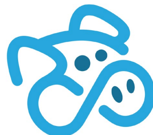
「データの貯金箱」ロゴ